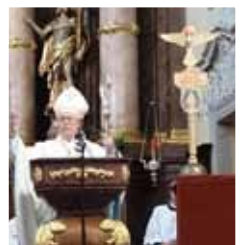
Feier am Pöstlingberg bei Linz mit Bischof Ludwig Schwarz