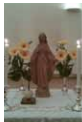
Feier in Innsbruck mit Bischof Scheuer