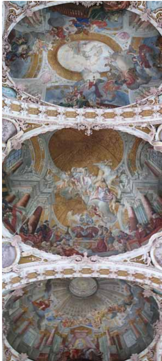
Decke im Dom zu St Jakob, Innsbruck.

Gnade ist Mittun-Dürfen am Werk der Erlösung (vgl. 1 Kor 3,9; 2 Kor 6,1). Der erlöste Mensch ist Mitarbeiter im Reich Gottes in der Nachfolge Jesu. Sendung, d. i. Mission als Grundvollzug der Kirche: „Ein Grundwort kirchlichen Lebens kehrt zurück: Mission. Lange Zeit verdrängt, vielleicht sogar verdächtigt, oftmals verschwiegen, gewinnt es neu an Bedeutung.“ (Kardinal Karl Lehmann) Mission ist ein, nein das „Weitersagen, was für mich selbst geistlicher Lebensreichtum geworden ist und dies – im Sinn von ‚Evangelisierung‘ – auf die Quelle zurückführen, die diesen Reichtum immer neu speist; auf das Evangelium, letztlich auf Jesus Christus