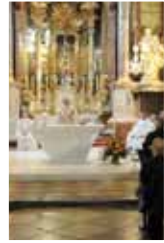
Feier in Maria Taferl mit Bischof Küng