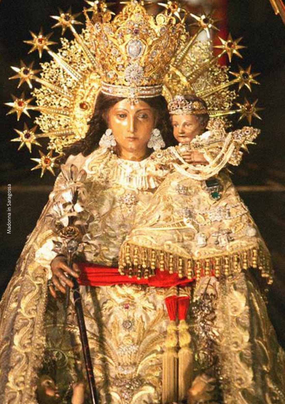
Madonna in Saragossa