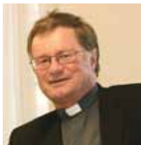
Manfred Scheuer, Bischof von Innsbruck