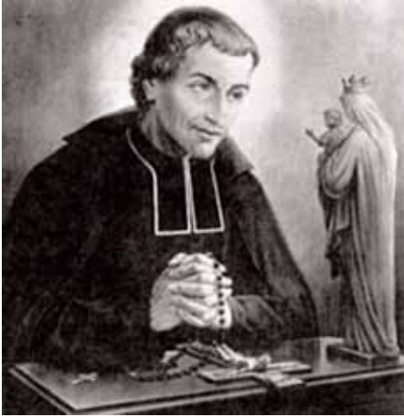
Hl. Ludwig Maria von Montfort.

an Christus durch die Hände Mariens“ lehnen sich an die Struktur und den Geist der Vollkommenen Hingabe nach Ludwig Maria Grignon de Montfort an. Es werden in diesen Tagen verschiede- ne Bereiche des Lebens betrachtet und durch Maria Gott geweiht. Es ist gut zu wissen, dass in der Form der Vollkom- menen Hingabe nach dem hl. Ludwig Maria zwei Elemente entscheidend sind: 1. dass man wirklich alles Maria hingibt: „Ich bin GANZ Dein, meine Königin und meine Mutter, und ALLES, was ich habe ist Dein.“ 2. dass mit dem formel- len Akt die Hingabe nicht geschehen ist, sondern beginnt. Mit dem Hingabever- sprechen beginnt erst der Vollzug der Hingabe, das Leben für Maria, mit Ma- ria, durch Maria und in Maria. „Maria muss das ganze Leben in Besitz nehmen, nicht nur Minuten oder Stunden, sonst hat der Weiheakt – und wenn man ihn noch so oft wiederholt – nur den Wert eines vorübergehenden Gebets.“ (HB S 55)